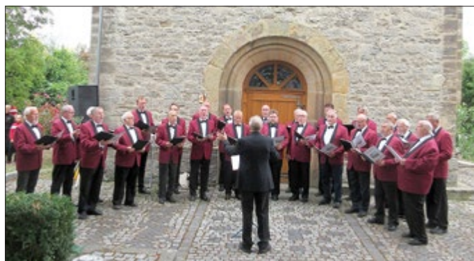
Auftritt zum Kapellenfest 2019