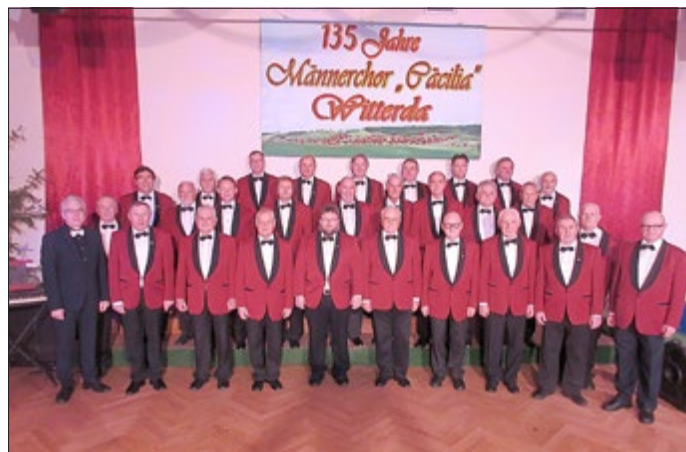
2019 konnte der Chor sein 135-jähriges Gründungsjubiläum begehen. Höhepunkt war ein Sängerfest mit 6 Gastchören und zahlreichen Gästen aus nah und fern.

Der Männerchor „Cäcilia“ Witterda e.V. ist einer der traditionsreichsten Vereine in der Gemeinde Witterda. Er besteht seit 1884 und war seither - außer während der beiden Weltkriege - durchgängig aktiv. Zuletzt ruhte wegen Corona das Vereinsleben. Seit seinem Bestehen hat der Chor zahlreiche Höhen und Tiefen erlebt. Einer Blütezeit in den 1950er Jahren mit zeitweise mehr als 50 Sängern folgte nach der Zwangskollektivierung der einzelbäuerlichen Betriebe unseres Dorfes fast der Zusammenbruch, als der Chor in kurzer Zeit bis auf 16 Sänger schrumpfte. Dank der Initiative des damaligen Vorstandes gab es in den 1970er Jahren wieder einen Aufschwung, bei dem die Sängerschar noch einmal auf 42 Sänger anwuchs. Heute zählt der Verein 31 Mitglieder, von denen durchschnittlich 23 Sänger regelmäßig am Übungsbetrieb teilnehmen.