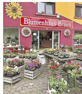
Bild links: Katjas Blumenstübchen in Elxleben, Bild rechts: Blumenhaus Braun in Gebesee

Geöffnet sind die Kinder- und Jugendtreffs zu den gewohnten Zeiten, montags in Witterda, dienstags und mittwochs in Elxleben sowie mittwochs und donnerstags in Gebesee: Vor Ort jeweils 15 Uhr bis 17 Uhr und digital ab 12:30 Uhr für Beratung, Hausaufgabenhilfe und Unterstützung beim homeschooling.